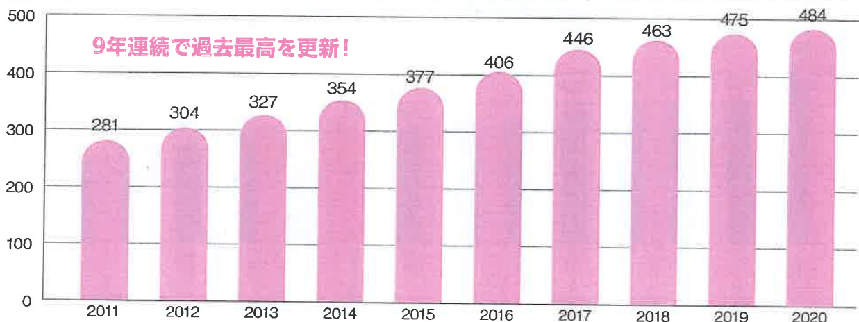
内部留保(利益剰余金)の推移(兆円)

国や地方の財政赤字が深刻になる中で、コロナ禍で莫大な利益を上げる企業もあります。コロナ対策・生活再建のため3年間の限定で消費税率をゼロとして、生活を助け購買力増で経済に活力を取り戻します。財源として大企業の内部留保金への課税を提案します。所得税累進課税を強化し、法人税や優遇税制、金融課税を見直し、大企業や富裕層には応分の負担を求める税制改革を断行します。